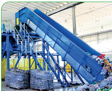
Tecnologias para melhorar a qualidade do serviço são marcas da SUMA Brasil

Empresa associada tem origem em grupo português e está atuando há 50 anos no mercado brasileiro