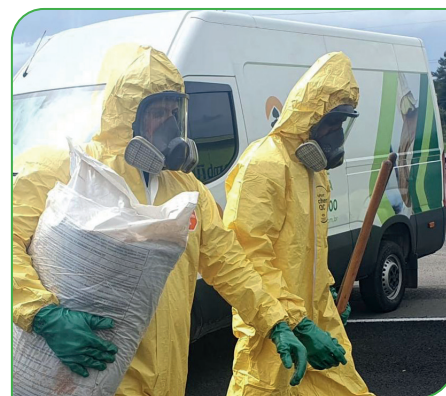
Há uma relação direta entre as mudanças climáticas e o trabalho da Emergenciall