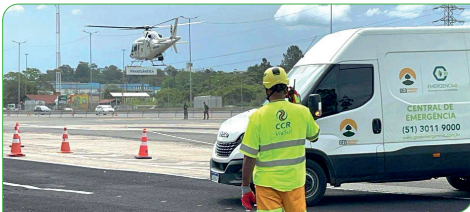
Profissionais qualificados e equipamentos específicos estão dispostos em bases de atendimento em todo o país

Algumas das companhias que necessitam desse tipo de serviço têm obrigatoriedade de contratação devido aos riscos envolvidos em seus processos e aos tipos de produtos que são manipulados. Outras, mesmo sem a obrigatoriedade, entendem a existência de riscos que podem vir a causar algum dano ambiental, e que é importante ter um parcei-