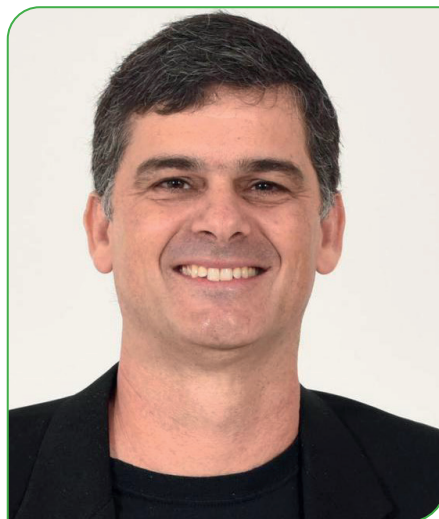
Para o diretor executivo, humanização do atendimento e preço justo são essenciais